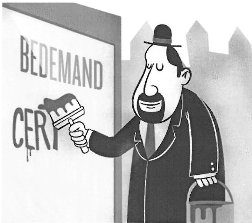
Vil du være sikker på, at bedemanden er certificeret efter brancheforeningens standarder, så skal du kigge efter DS-logoet.

Internetportalen Begravelsesguiden.dk, der oplyser forbrugere om begravelser, udsteder deres egne certifikater til bedemænd under ordningen SynligPris. Begravelsesguiden.dk udsteder selv certifikatet og det medfølgende logo til bedemænd, der åbent lægger deres priser frem på hjemmesiden. Cirka 20 bedemænd er med i ordningen, herunder de internetbaserede kæder (som ikke har fysiske butikker) BedreBegravelse.dk og Danske Begravelser.